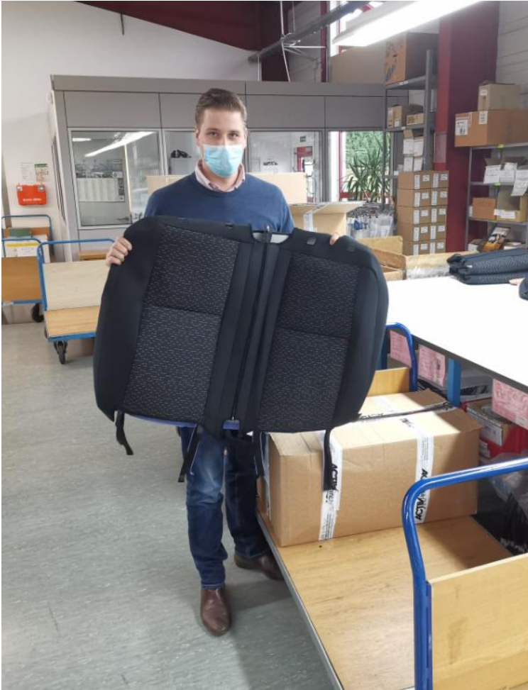
... und präsentiert die fertige Ware, die nun durch die Qualitätskontrolle muss